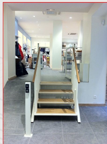
Fig. 2 : Position escalier