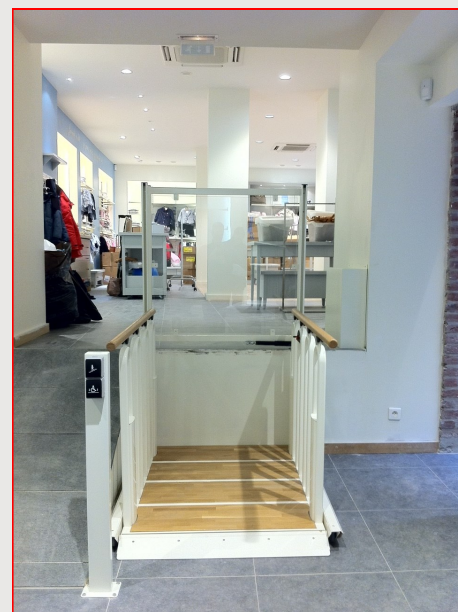
Fig. 1 : Position basse en élévateur

Ce produit est conforme à la directive machine 2006/42/CE